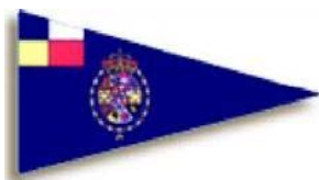
Real Club Nautico de Barcelona